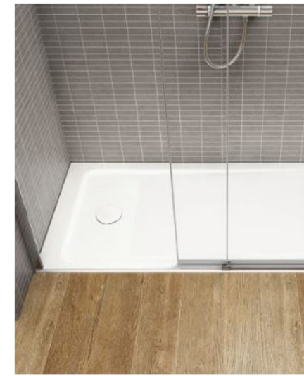
15 Duchas y Bañeras

Incorporamos inodoros de porcelana vitrificada de color blanco. Inodoro de la marca ROCA modelo The Gap Square de salida dual compacto de tanque bajo o similar.